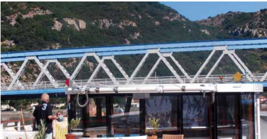
Manchmal war nur eine Armlänge Platz zwischen Sitzplatz an Deck und Brückenunterseite.

Die A-Rosa Schiffe sind mit modernster Technik ausgerüstet. So ist für das Abwasser eine Kläranlage mit vier Kammern an Bord, die das aufgearbeitete Wasser mit