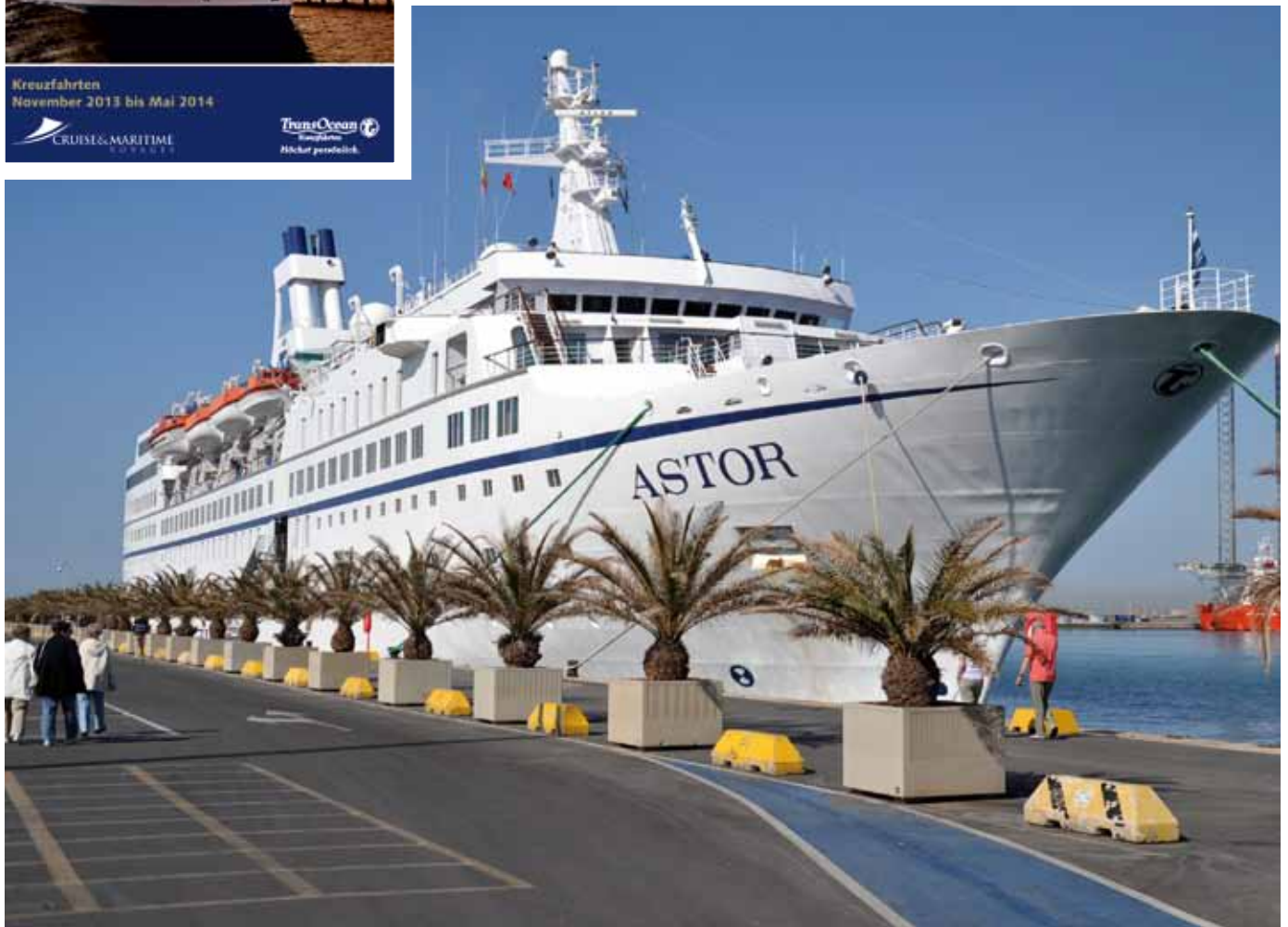
Die MS Astor, hier im Hafen der spanischen Hafenstadt Sevilla.