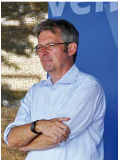
SPD-Bundestagskandidat Achim Post