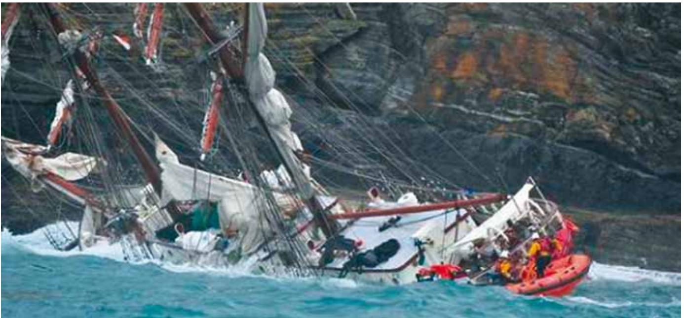
... und nachdem sie auf ein Riff vor den Felsen gelaufen ist.