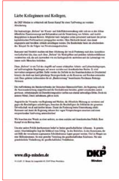
DKP-Flugblatt bei der Verdi-Kundgebung