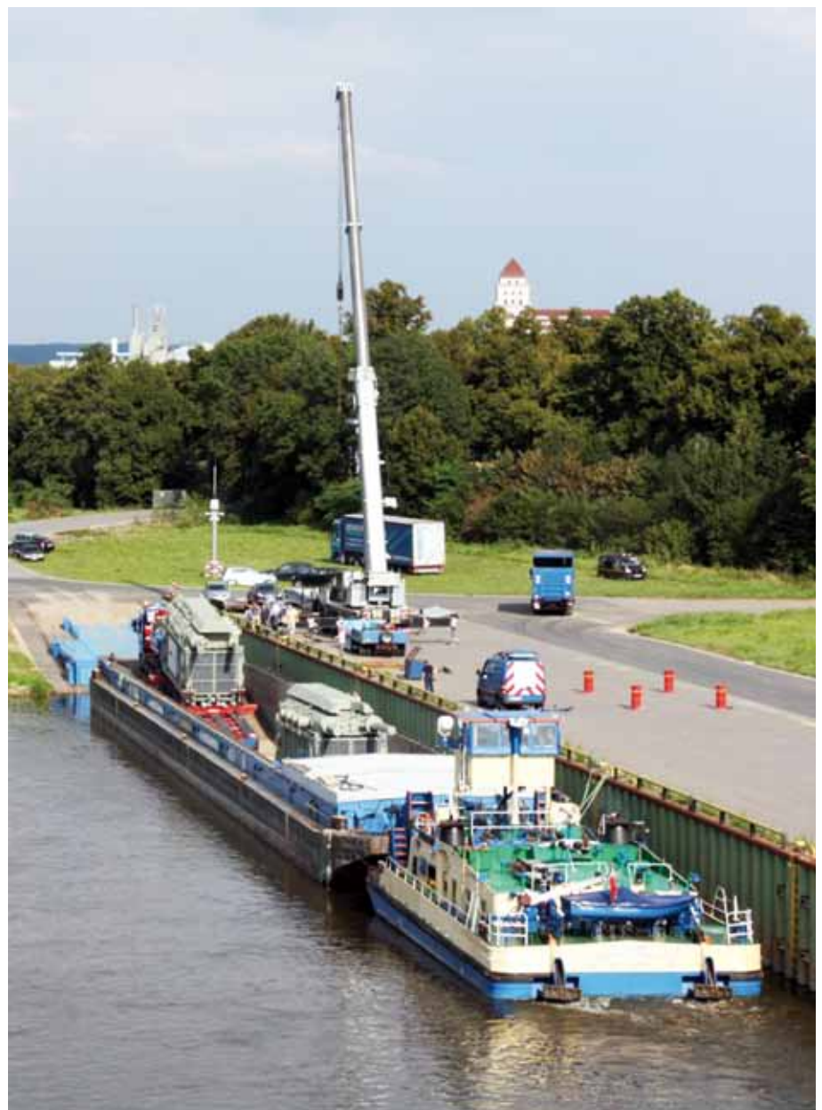
Die LKWs rollten nacheinander in einen sogenannten Drive-In-Leichter der Ro-Ro-Service Berlin GmbH

Die Ro/Ro-Anlage wurde 2007 von der Sächsischen Binnenhäfen Oberelbe GmbH errichtet und wird seit 2008 von der Sachsenland Transport & Logistik GmbH Dresden betrieben. Mit der Ro/Ro-Anlage können Schwerlasten und Projektladungen bis 450 Tonnen ohne den Einsatz von Krantechnik verladen werden, da der beladene LKW direkt auf das Binnenschiff hinauf- und wieder herunterfahren kann. ■