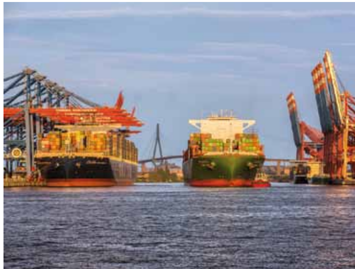
Großcontainerschiffe im Hamburger Hafen

Welthandelswachstum 2013 von 3,1 Prozent eingestuft wird, und einer sehr positiven Entwicklung der Ostsee-Containerverkehre. In den ersten sechs Monaten des Jahres wurden im Containerverkehr zwischen dem Hamburger Hafen und der Ostseeregion insgesamt 1,1 Millionen TEU umgeschlagen. Das entspricht einem Plus von 8 Prozent. Sieben neue Feederdienste im Hamburger Hafen bieten zusätzliche Transportkapazität und verstärken das Liniendienstangebot in die Ostsee. Mit wöchentlich mehr als