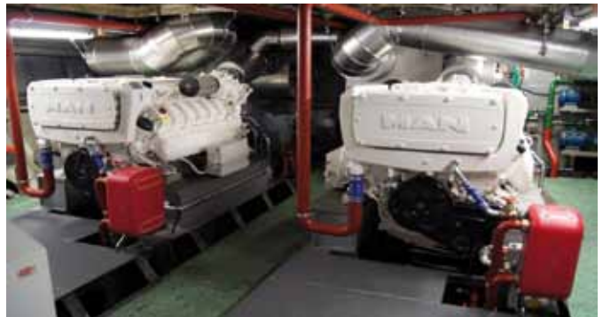
Der Maschinenraum nach der Neumotorisierung