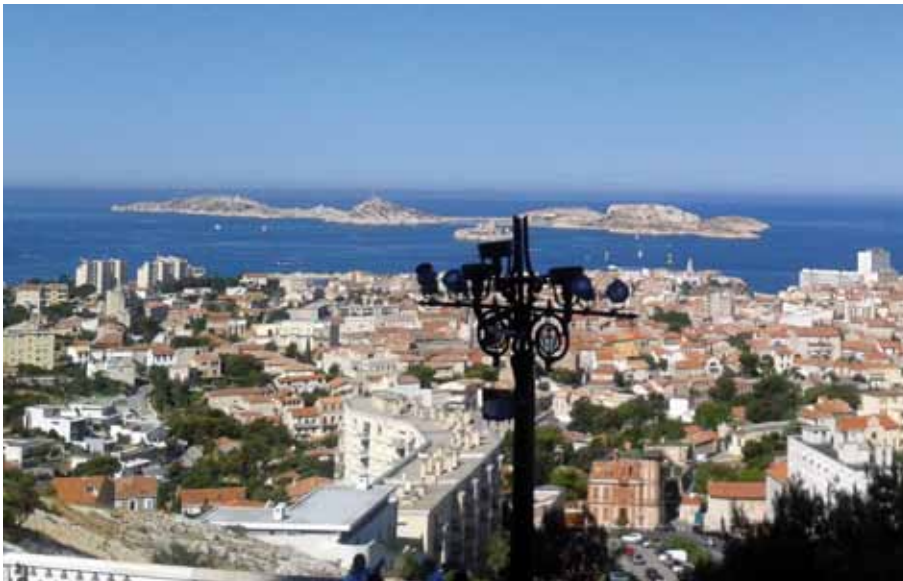
Die Passagiere können auch Marseille, die Kulturhauptstadt 2013, besichtigen.

Ergebnis für Schifffahrtfans ist sicher auch das Liegen der Flusskreuzfahrtschiffe im sogenannten „Päckchen“. D.h., dass zwei oder drei Schiffe nebeneinander vor Anker liegen.