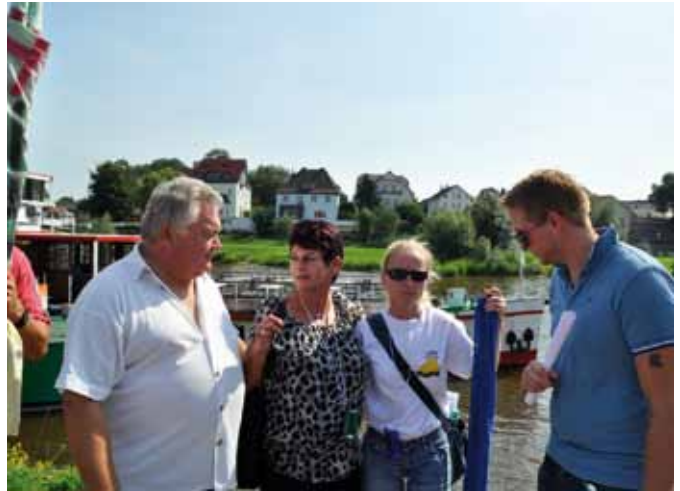
Partikuliere in der Diskussion: „Dieser Verdi-Streik ist eine Frechheit und bedroht unsere Existenz!“

Bsirske die Tatsachen, wenn er behauptet, Ramsauer sei schuld. Die Gewerkschaft hat den Streik angezettelt und durchgezogen, nicht der Bundesverkehrsminister!“