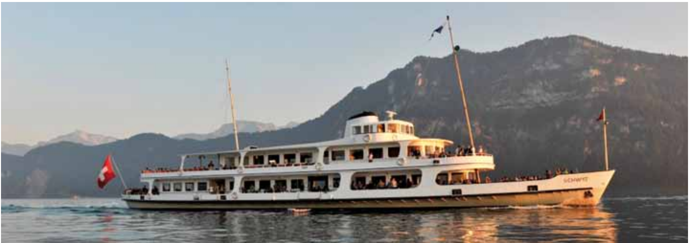
MS Schwyz auf Sonnenuntergangsfahrt.