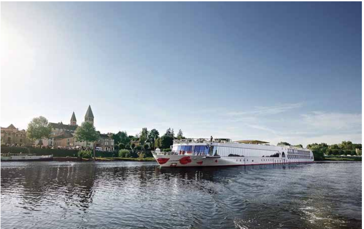
Die A-Rosa Stella auf der Rhône