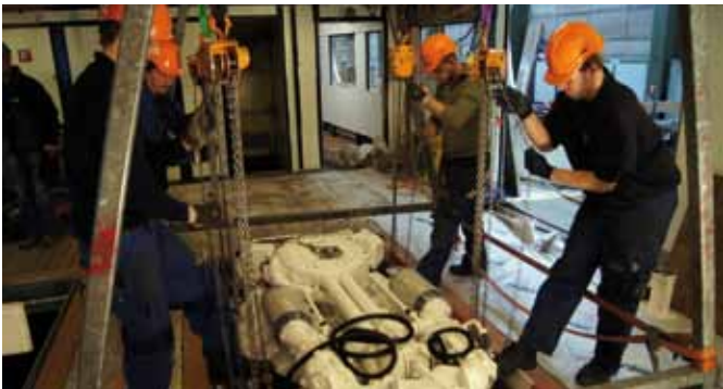
Das Einsetzen der neuen Motoren durch eine Luke

Ein weiteres Problem stellte der große Gewichtsverlust durch die beiden neuen Motoren dar. Wog einer der alten Sulzer-Motoren noch 11.450 Kilogramm, bringt einer der neuen Motoren gerade noch 2.300 Kilogramm plus 660 Kilogramm je Getriebe auf die Waage. Diese großen Unterschiede zogen aufwendige Schwerpunkt- und Stabilitätsberechnungen nach sich, die ebenfalls durch die eigene Engineering Abteilung der Shiptec AG durchgeführt wurden. Jedes einzelne Ein- und Ausbauteil musste dabei separat gewogen werden. Um die Vorgaben der Behörden bezüglich der Stabilität des Schiffes einzuhalten, musste die gewaltige Gewichtsreduktion mit insgesamt 9,5 Tonnen neuem Ballast ausgeglichen werden. Trotz Einbau eines doppelt so großen Abwassertanks und neuer Partikelfilter ist das Schiff jedoch in betriebsbereitem Zustand schlussendlich um zwei Tonnen leichter als vor der Sanierung. ■