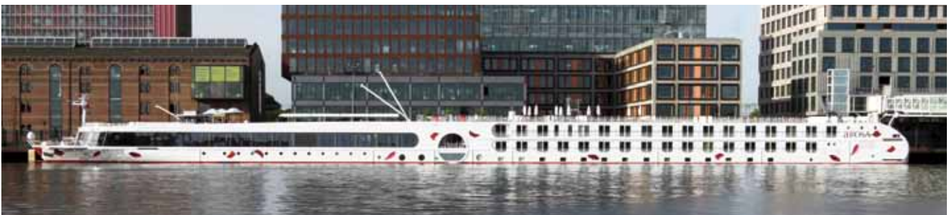
Das Flaggschiff der Flotte ist momentan die A-Rosa Silva, hier vor der Taufe im Juli 2012 in Amsterdam.

Schon abends geht es mit dem Schiff weiter nach Avignon. Der Papstpalast in Avignon aus dem 14. Jahrhundert gehört genauso wie die berühmte Brücke Pont Saint-Bénézet zum UNESCO-Weltkulturerbe. Die Ruine der Bogenbrücke ist bekannt durch das Lied „Sur le pont d'Avignon“. Vom Schiff aus hat man einen wunderschönen Blick auf die beleuchtete Stadt und die Brücke. Ein Er-