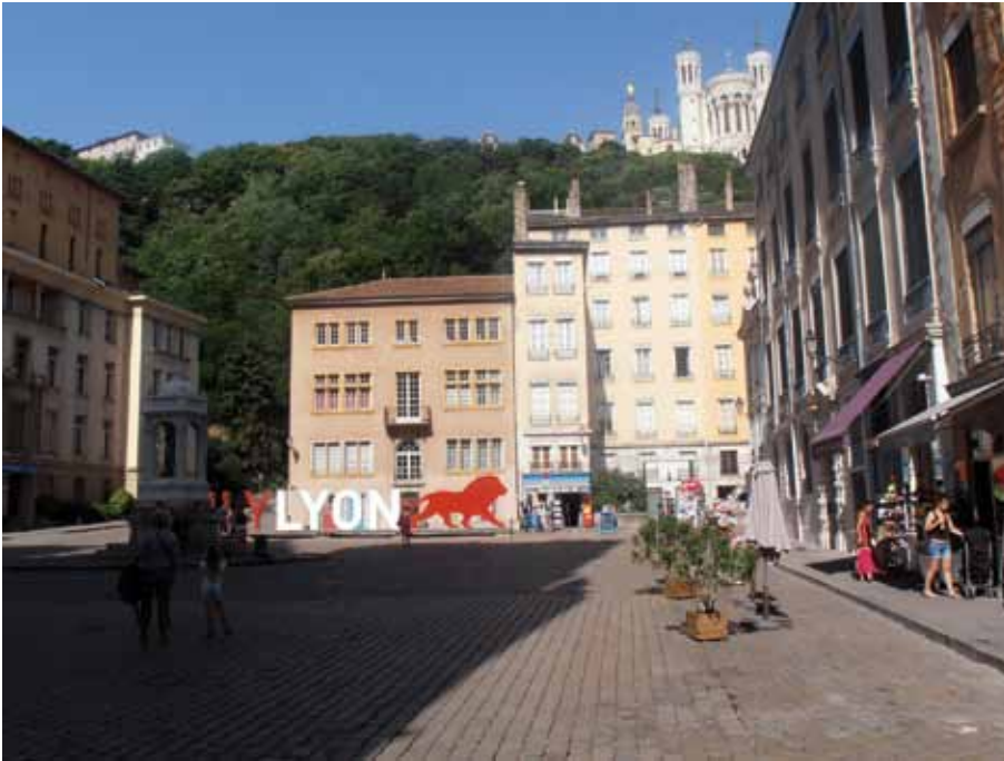
Die achttägige Tour mit dem Flusskreuzfahrtschiff A-Rosa Stella auf der Route Méditerranée startet und endet in Lyon.

„Die Position auf dem Schiff ist viel vielseitiger als im Hotel. Hier bin ich zuständig für die Buchhaltung, Ausflüge, Shop, Rezeption, Entertainment und die Reiseorganisation“, erzählt sie.