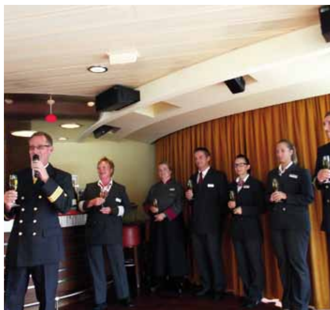
Zum Schluss der Reise verabschiedeten sich Besatzung und Passagiere bei einem Sektempfang voneinander.

Auf dem Rückweg von Port St. Louis nordwärts nach Lyon hat man einen halben „Seetag“ auf dem Fluss, an dem man alle Annehmlichkeiten an Bord ausprobieren kann, wie die vielfältigen Massageangebote, den Pool an Deck oder einfach nur die Poolliegen, bis es dann wieder heißt „Kopf einziehen!“, denn auch auf dem Rückweg werden natürlich wieder viele Brücke durchfahren. ■