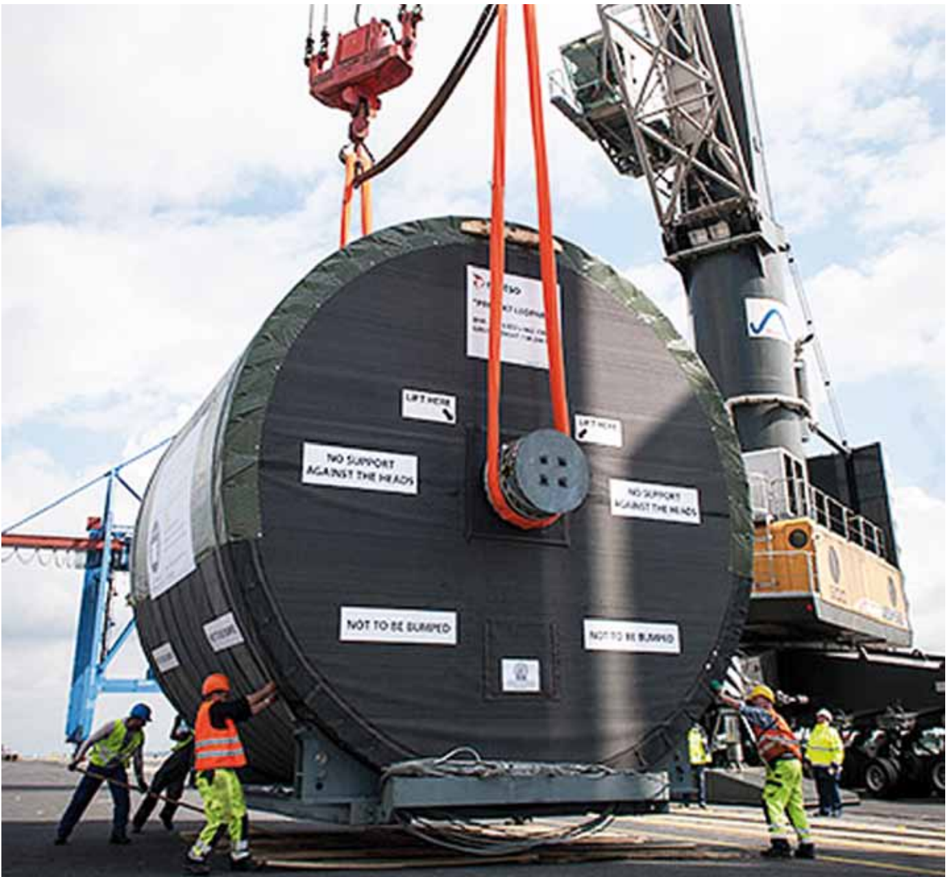
Erfolgreiche Premiere eines Tandemumschlags im Seehafen Brake.

Die beiden Hafemobilkrane am Braker Niedersachsenkai werden nach diesem ersten erfolgreichen Tandemumschlag noch „synchronisiert“, d.h. elektronisch zusammenschaltet. Zukünftig können beide Krane zusammen dann bis zu 280 Tonnen heben. ■