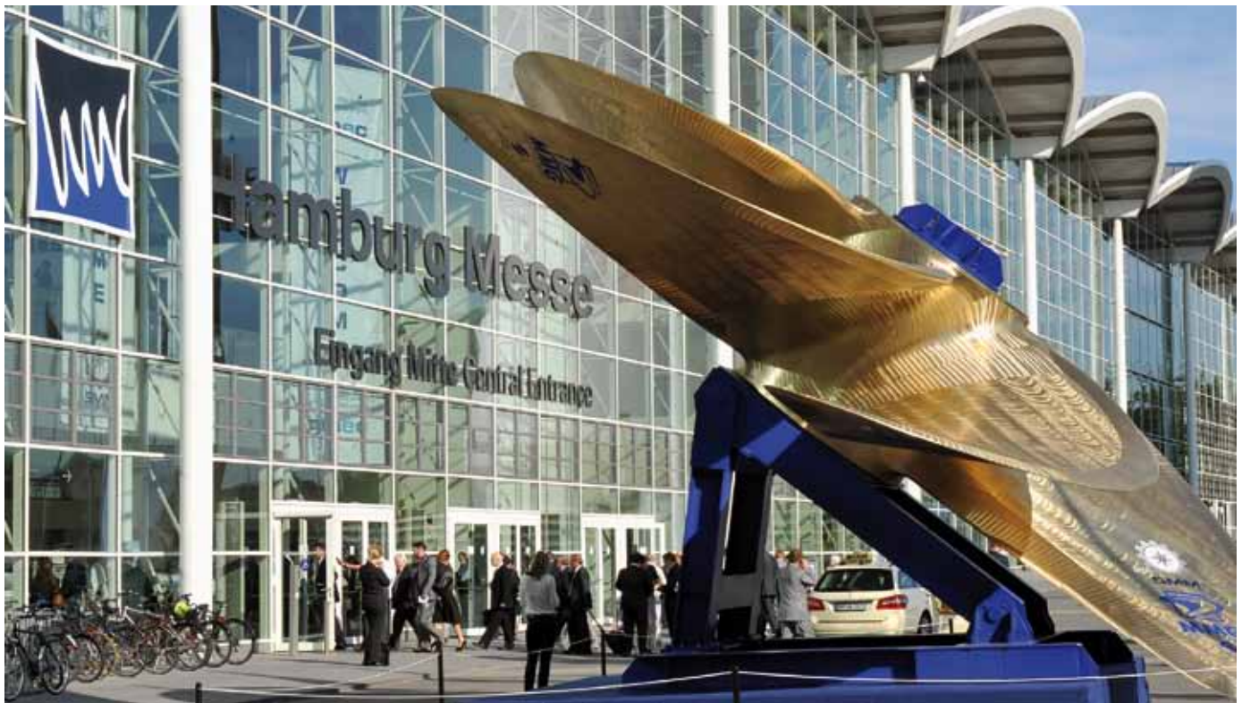
Der Eingang Mitte der Hamburger Messehallen.