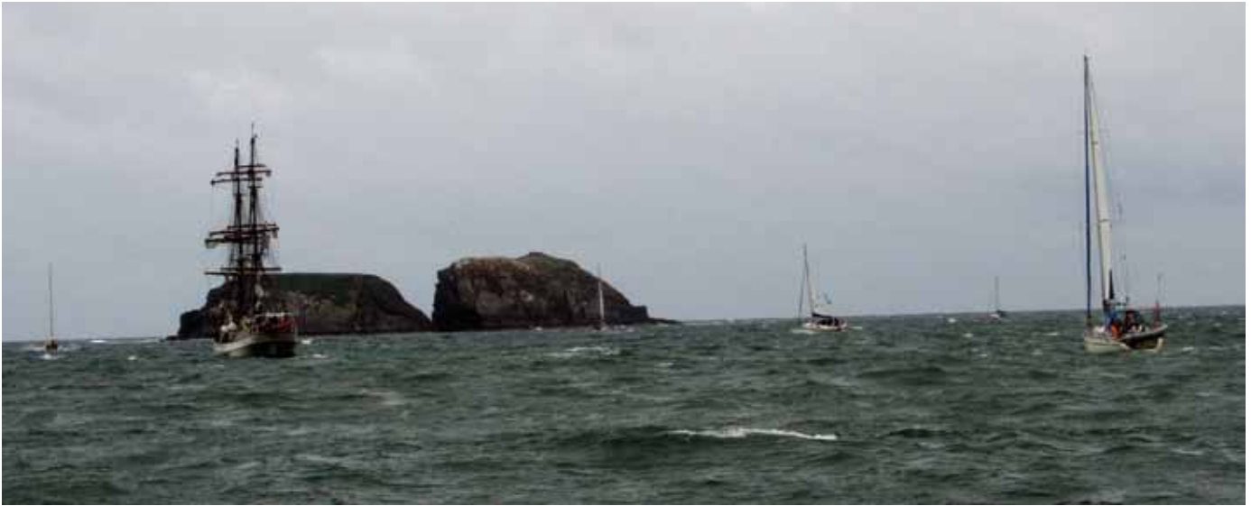
Das Segelschiff „Astrid“ in der See vor Kinsale ...