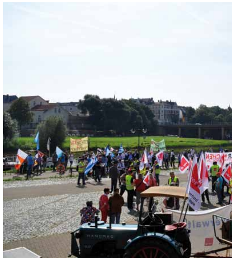
Nach Angaben der Gewerkschaft Verdi waren 1100 WSV-Mitarbeiter zur Kundgebung und andere von 400 - 600. Dieses Foto entstand während der Kundgebung um