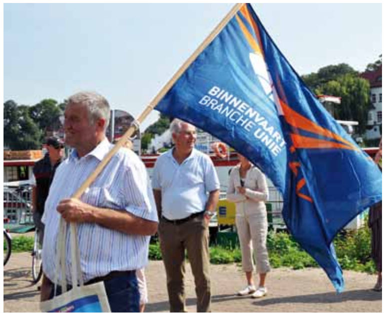
Binnenschiffer aus den Niederlanden

Mitarbeiter bitte. Als Folge des Streiks hätten sie sicherlich lange Liegezeiten und möglicherweise finanziellen Schäden erlitten, aber in der Wasser- und Schifffahrtsverwaltung seien tausende Existenzen in Gefahr. Bsirske empfahl den betroffenen Binnenschiffern, sich doch an Bundesinnenminister Friedrich oder an Bundesverkehrsminister Ramsau-