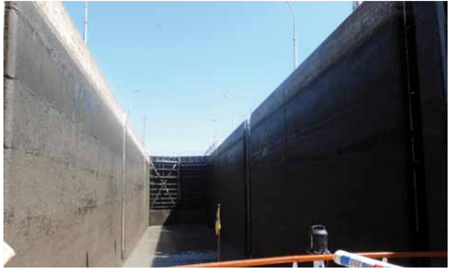
Ein Highlight für die meisten Passagiere: Die Schleuse Bollnäs mit einer Hubhöhe von rund 23 Metern.

Trinkwasserqualität wieder in die Rhône spült. Die Küche hat fünf Tiefkühlräume inklusive einem Müllkühlraum.