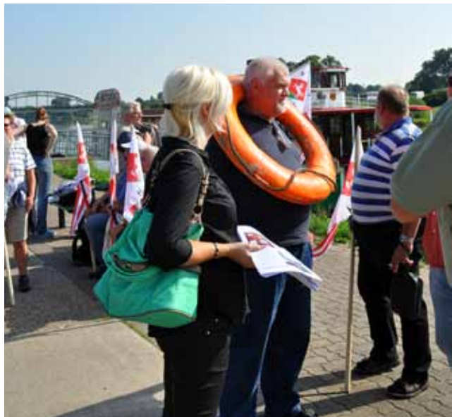
Mit Rettungsringen gegen den Untergang als Partikulier - und die Streikaktion der Gewerkschaft.