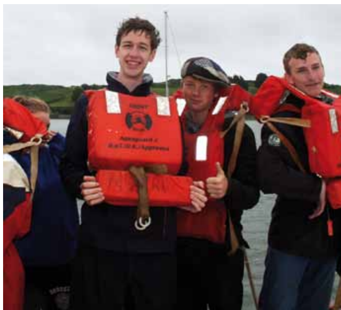
... und sind glücklich über ihre Rettung.

Aber auch für junge und ältere Paare bietet die Insel viel Abwechslung. Irland sollte für jeden, der die Insel noch nicht besucht hat, ein Punkt auf seiner Damuss-ich-noch-hin-Liste sein. ■