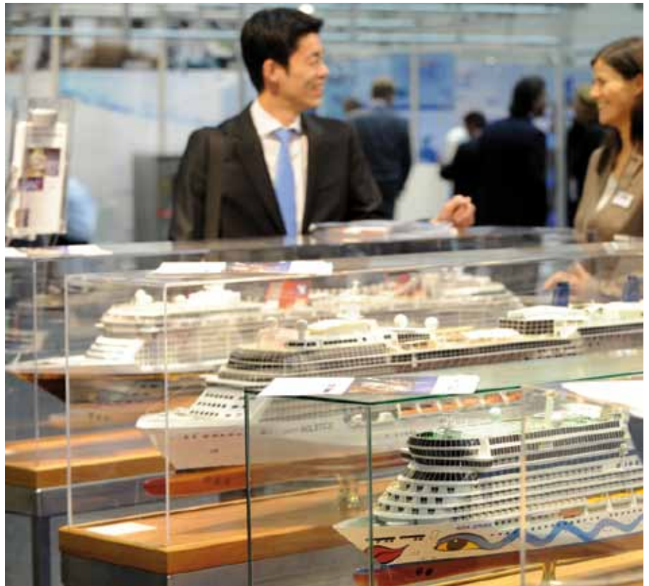
Exponate auf der Seatrade Europe.

Grundlage der Veranstaltung ist der gmec (global maritime environmental congress) Hamburg, ein branchen- und länderübergreifender Kongress zum Thema Maritimer Umweltschutz, der jeweils im Rahmen der SMM, der Weltleitmesse der maritimen Wirtschaft, ausgerichtet wird. Vertreter von IMO und EU-Kommission sowie Experten aus Politik, Wirtschaft, Wissenschaft und Umweltschutzorganisationen werden dabei innovative Konzepte zur Nachhaltigkeit diskutieren.