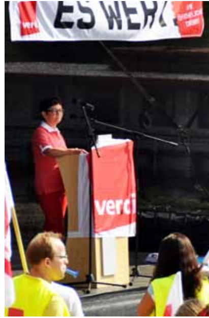
Inge Höger MdB, Die Linke