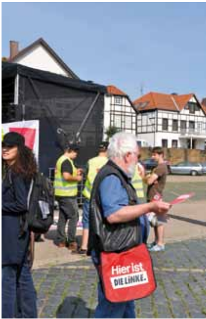
Mitgliederwerbung für die Linken