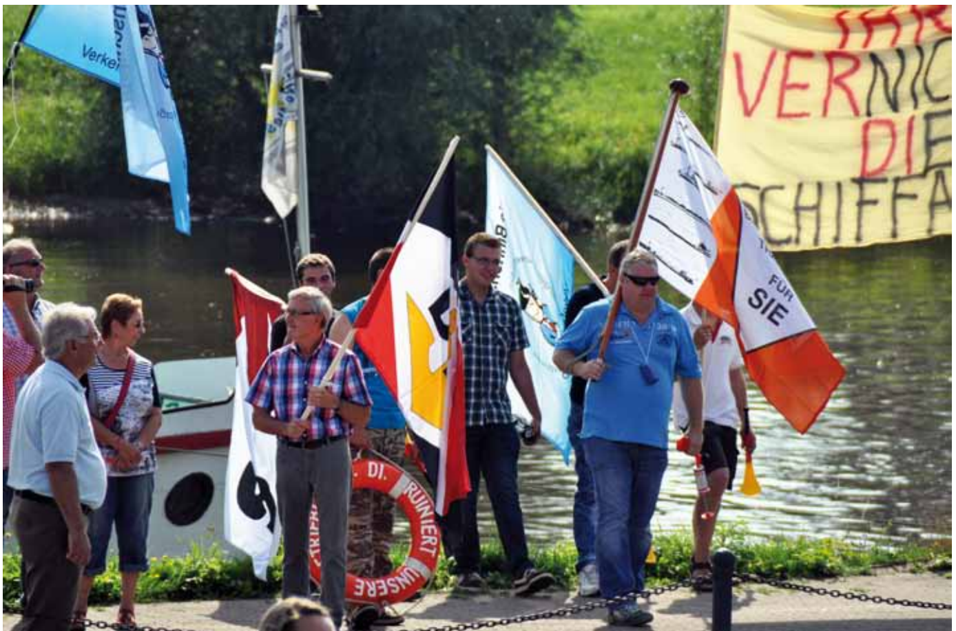
Am Ufer der Weser warten die Binnenschiffer auf die Verdi-Demonstranten, ...

Von Aggressivität auf Seiten der Binnenschiffer keine Spur, wohl aber eine im Zaum gehaltene Wut und deutlich spürbare Enttäuschung darüber, dass sie hier in einen Arbeitskampf hineingezogen worden sind, mit dem sie eigentlich nichts - aber auch gar nichts - zu tun haben, denn es geht um einen Streit zwischen der Gewerkschaft Verdi und dem Bundesverkehrsministerium, der mit brutal durchgezogenen Schleusensperren auf dem Rücken der Binnenschiffer geführt wird. Viele Partikuliere wurden durch diesen Streik, der seit Anfang Juni