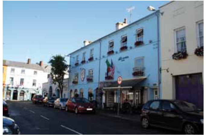
Übernachtungstipp: Blue Haven Hotel

det. Nicht selten wurden die Trainees selbst als Kinder im Center ausgebildet. Kinder aller Altersklassen lernen im Camp spielerisch den Umgang mit der Materie - und werden auch über die Gefahr des Meeres aufgeklärt. Die Trainer sind Vorbilder und die Kinder haben sichtlich Spaß an den Aktivitäten.