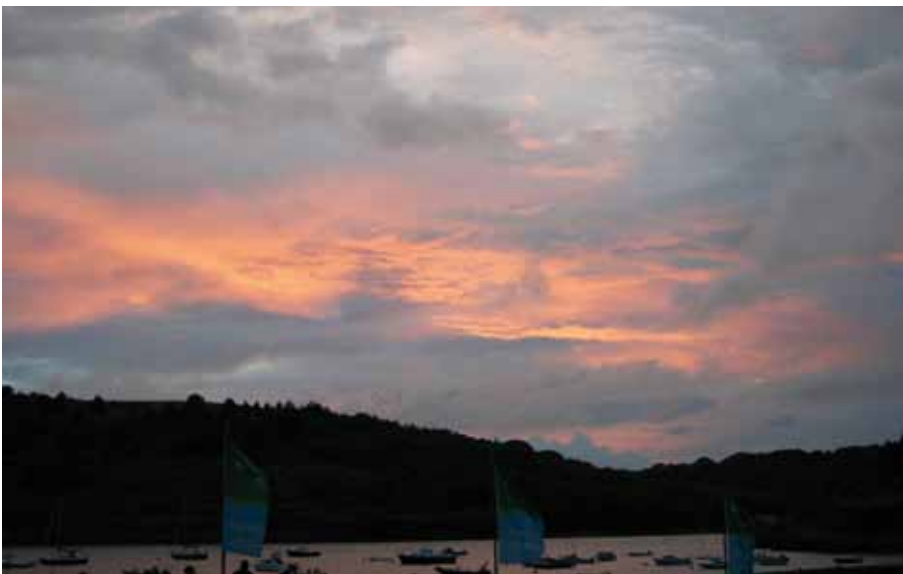
Diese Aussicht auf die Bucht von Oysterhaven kann genießen, wer lang genug auf der Terrasse des Segel-Centers verbringt.