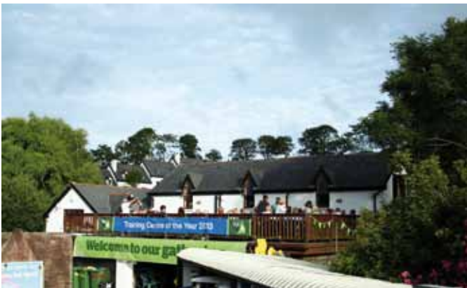
Beliebter Seglertreff: Das Oysterhaven Center im irischen Kinsale

Welt eingeladen, nach Irland zu kommen und zusammen mit Freunden eine schöne Zeit zu verbringen. Ein Schauplatz solcher Treffen, ist der kleine und sehr charmante Ort Kinsale im Süden von Irland. Die nächste größere und bekanntere Stadt ist Cork, das in rund 40 Minuten mit dem Bus zu erreichen ist. Cork wird auch von