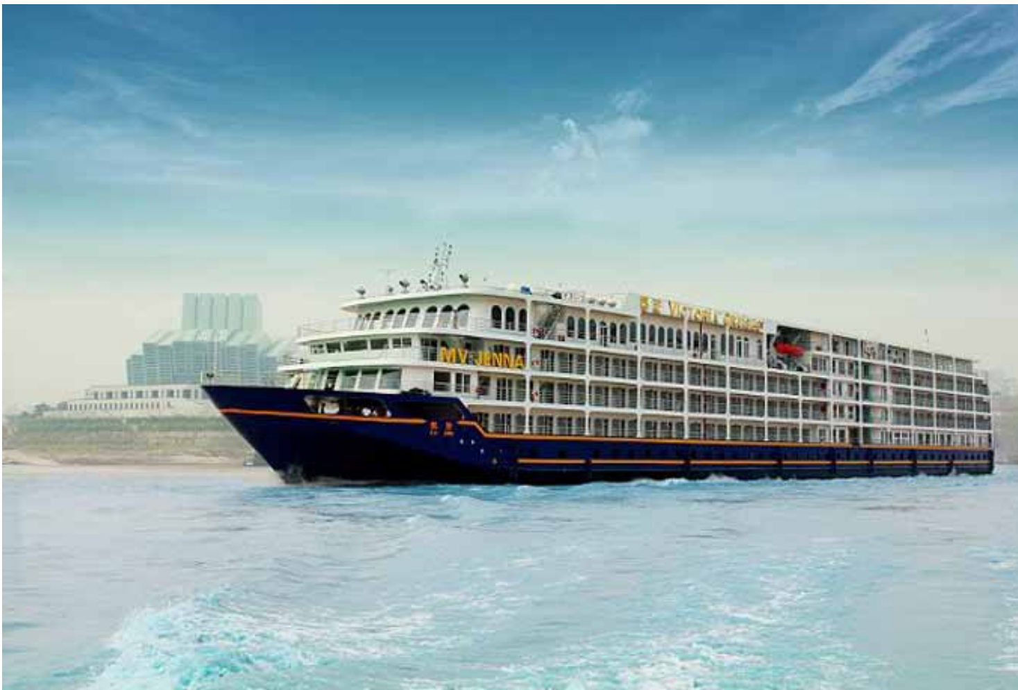
An Bord der Victoria-Cruises- Flusskreuzfahrtschiffe wird ab sofort superschnelle Internetverbindung im 3G Standard angeboten

Überdurchschnittlich viele Außenkabinen mit eigenen Balkonen garantieren den Passagieren uneingeschränkte Sicht auf alle Sehenswürdigkeiten. Flusskreuzfahrten mit Victoria Cruises sind bei zahlreichen deutschen Reiseveranstaltern buchbar. Weitere Informationen können Interessierte im Internet unter www.VictoriaCruises.com abrufen.