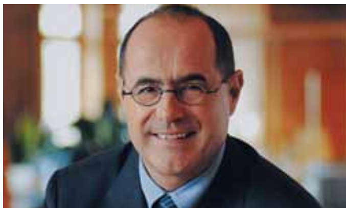
Ständerat Dr. Claude Janiak