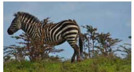
Zebbras sind kluge Tiere, sie führen die harmlosen Gnus an die Wasserstellen