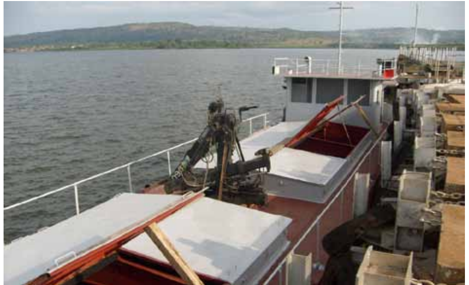
Die Schifffahrt auf dem Lake Victoria - oft weisen deutsche Binnenschiffer als Entwicklungshelfer ihre afrikanischen Kollegen in die Navigation ein - verbindet die Anrainerstaaten Kenia, Uganda und Tansania