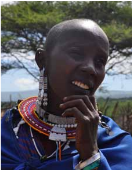
Eine Massai-Frau in einem Dorf in der Nähe des Ngorongoro-Kraters