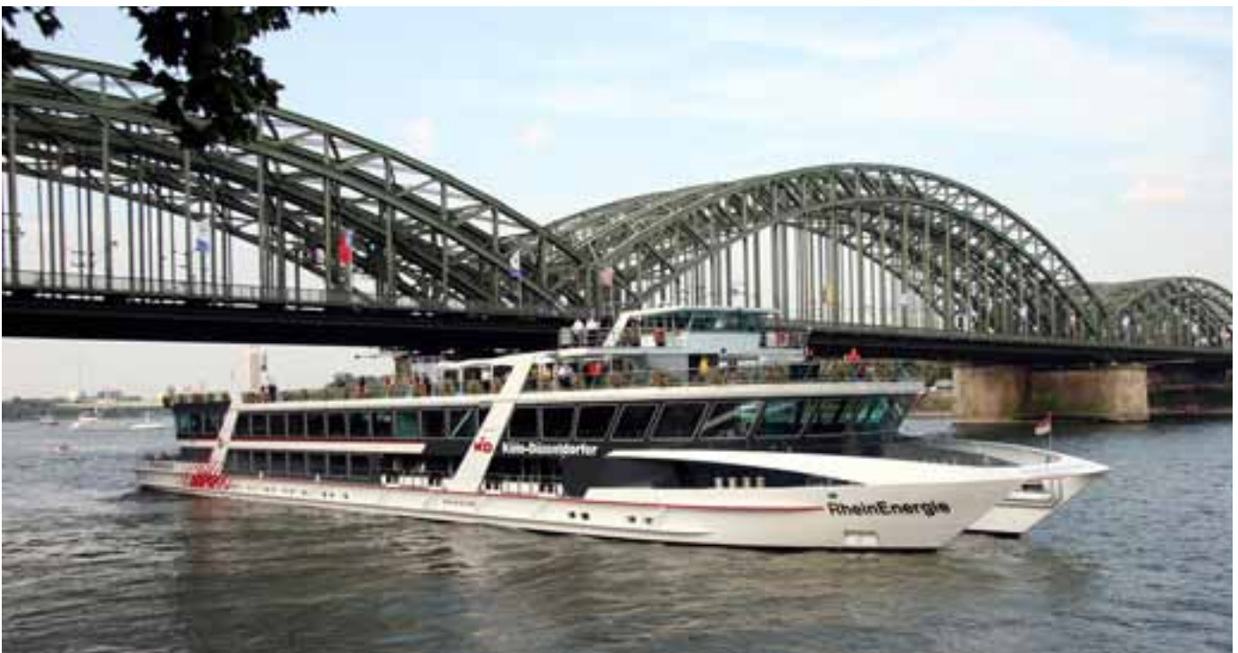
Der Katamaran „Rheinenergie“ ist das Flaggschiff der Köln-Düsseldorfer.

Flottenzuwachs hat die Köln-Düsseldorfer in Frankfurt am Main zu vermelden. Mit dem modernen, 2006 gebauten Ausflugschiff MS Palladium setzt die KD ihre lange Tradition in der Mainmetropole fort. Im Angebot sind täglich einstündige Panoramafahrten zum Preis von EUR 7,80. Beste Aussicht auf die Skyline und das Lichtermeer versprechen auch die beliebten Frankfurter Feuerwerksfahrten, die ebenfalls auf MS Palladium buchbar sind. Das komfortable Schiff ist ganzjährig exklusiv für Charterfahrten zu mieten. ■