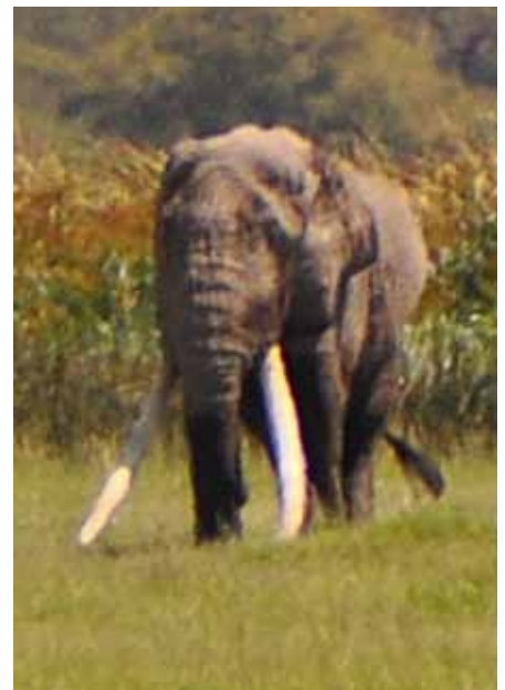
Dieser Elefant ist ca. 80 Jahre alt und wiegt etwa 7 Tonnen, jeder Zahn wiegt 120 kg