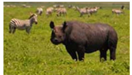
Rhinozerosse zählen zu den gefährlichsten Tieren der Welt