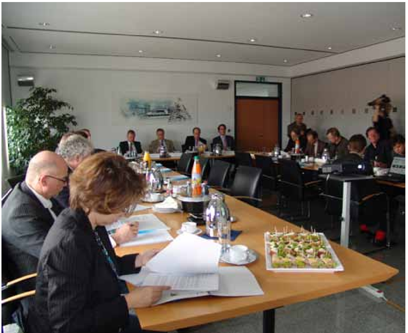
Reges Journalisteninteresse an der Jahrespressekonferenz des Duisburger Hafens.