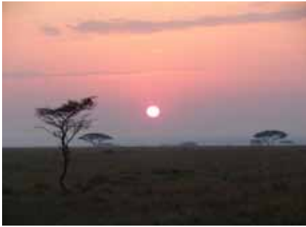
Wer einmal einen Sonnenaufgang - oder einen Sonnenuntergang - in der Serengeti erlebt hat, wird ihn nie mehr vergessen. Es ist ein traumhaft schönes Erlebnis.