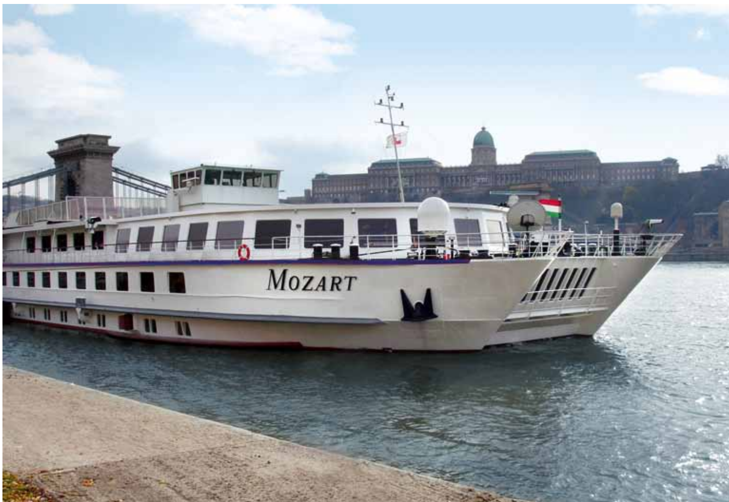
Am 1. April begann die „Mozart“, die in der Linzer Werft ÖSWAG grundlegend modernisiert wurde, in Passau ihre erste Reise.

Von April bis Oktober startet die MOZART zu insgesamt 30 Reisen ab Passau und steuert weltberühmte Städte wie Wien, Budapest und Bukarest an. ■