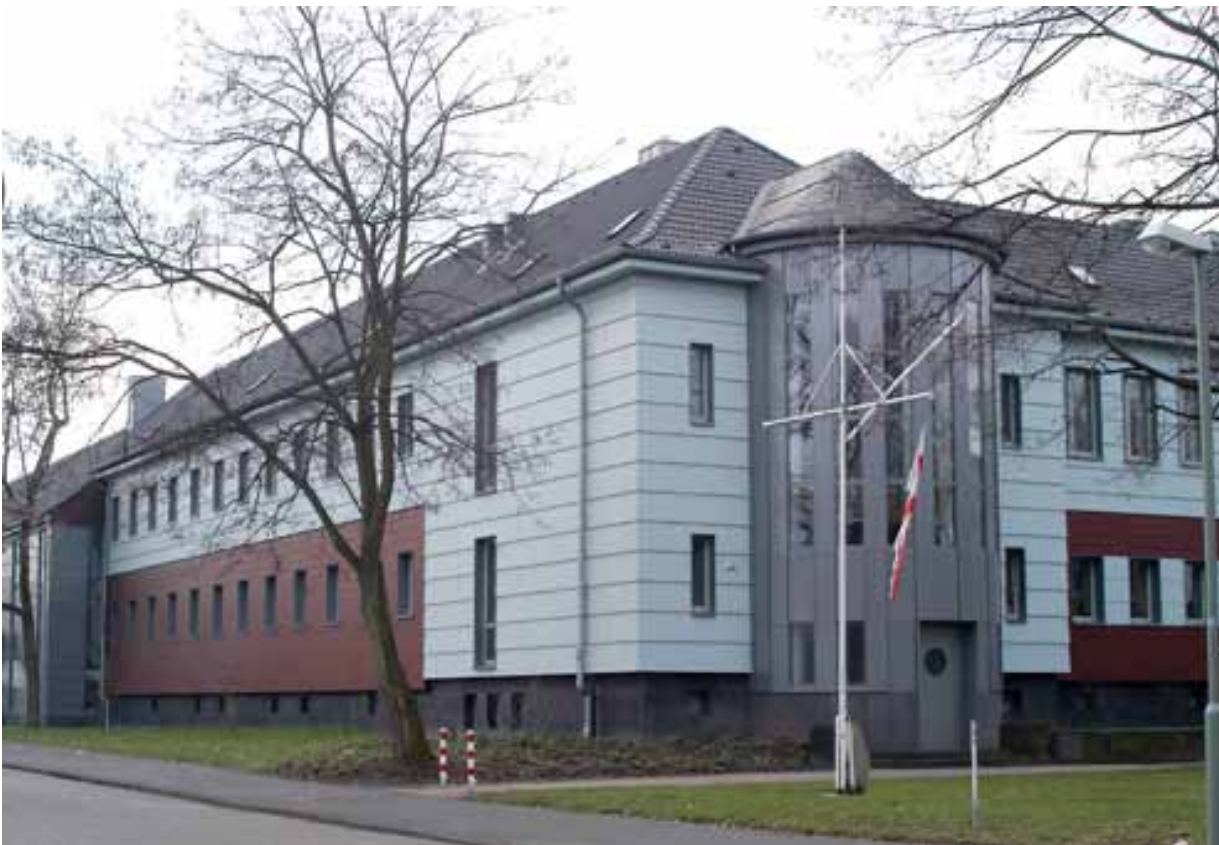
Das Schiffer-Berufskolleg in Duisburg-Homberg

Inhalte der dreijährigen Ausbildung sind neben Technik, Nautik und Ladungstechnik auch kaufmännische und rechtliche Grundlagen. Aufstiegschancen gibt es in Reedereien oder in den Häfen. Gelernte Binnenschiffer