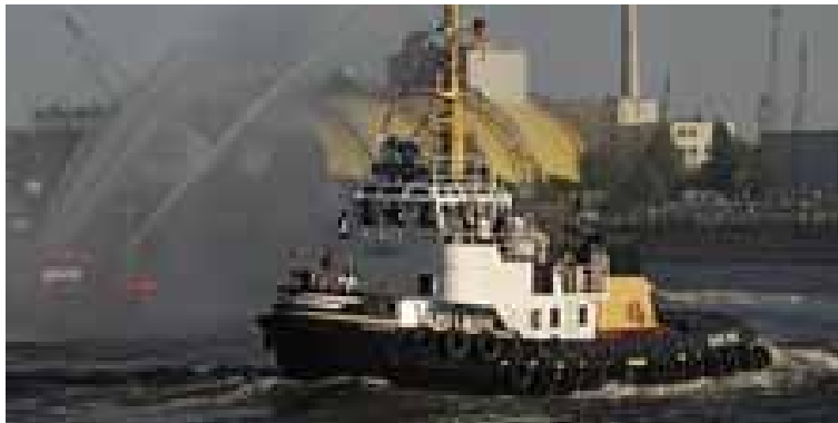
Zum Hafengeburtstag wird es auch ein Schlepperballlet geben.

Ein weiteres Programm-Highlight für Jungen und Mädchen findet am Samstag in der Fischauktionshalle statt. Unter dem Motto „Kochen für und mit Kindern“ werden hier an einer größtmäßig angepassten Küchengruppe kindgerechte Gerichte zubereitet – unter Anleitung von speziell geschulten Köchen, die das Kochen somit „kinderleicht“ machen. Während der Nachwuchs den Kochlöffel schwingt, können die Eltern