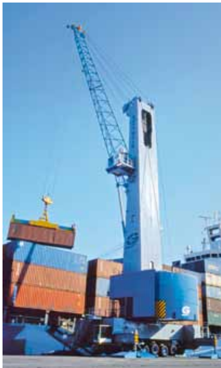
Hafemobilkran Modell 6 im Containerumschlag. An einem Kran gleicher Bauart hat Gottwald einen neuen Hybridantrieb erfolgreich getestet.

Hafemobilkrane arbeiten mit schnellen Lastwechseln verbunden mit diskontinuierlichen Senk-, Hebe- und Drehbewegungen einschließlich der zugehörigen Beschleunigungs- und Verzögerungsvorgänge. Daher sind Speicher erforderlich, die schnelle Leistungsaufnahme und -abgabe sowie hohe Zyklusrate bei rauem Kranbetrieb zulassen. Entsprechend hat Gottwald mechanische, elektrochemische und elektrostatische Kurzzeitspeicher untersucht. Die Anforderungen erfüllen elektrostatische reibungs- und verschleißlose Doppelschicht-Kondensatoren (Ultracaps) mit typischen Lade- bzw. Entladezeiten von max. 30 s im