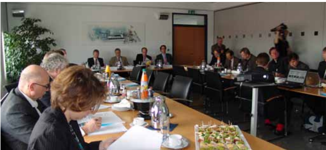
Reges Journalisteninteresse an der Jahrespressekonferenz des Duisburger Hafens. Foto: Sarah Artl / Seite 20

Erste Informationen hierzu unter Tel. 0211-383648