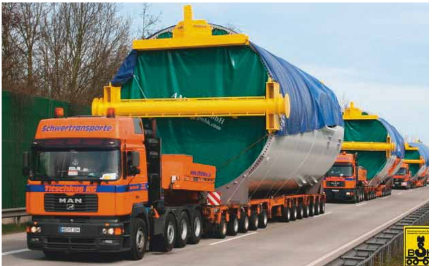
Mehr Schwergut aufs Wasser: Der Transport großer Güter erfordert entsprechende Kapazitäten und Sicherheitsmaßnahmen, die auf der Straße oft nicht zufrieden stellend gewährleistet werden können.

„Gerade für den Transport großer Güter bietet sich die Wasserstraße als ökonomisch und ökologisch sinnvoll an“, sagt Christian Betchen. „Darum ist die Verbesserung der Planbarkeit für Schwer- und Großraumtransporte über die bundesdeutschen Wasserwege eines unserer großen Ziele. Dafür haben wir auch ein Aus- und Weiterbildungsangebot für Fachkräfte aus der Logistikbranche und Patentinhaber in der Binnenschifffahrt aufgelegt. Doch es gibt noch viel zu tun, um die Einbindung des Kurzstreckenseeverkehrs und der Binnenschifffahrt auch dauerhaft im Tagesgeschäft zu vereinfachen. Gemeinsam mit der BSK werden wir hier noch viel bewegen.“ ■