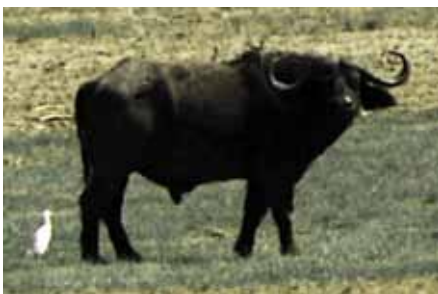
Büffel sind in den meisten tansanischen Nationalparks anzutreffen; sie sind gefährlich