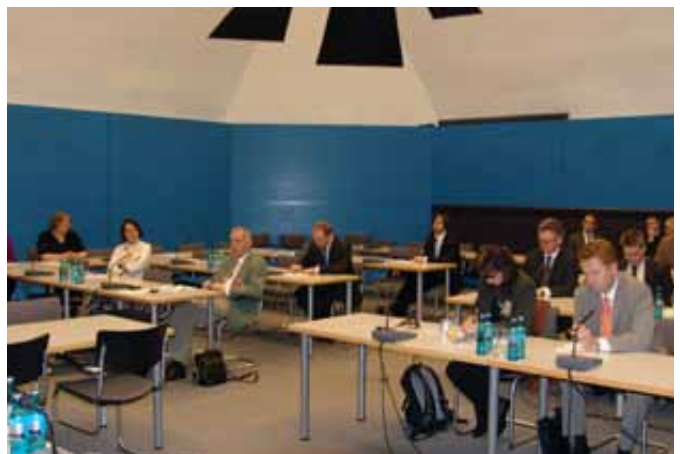
Im Fraktionssitzungssaal der FDP im Deutschen Bundestag fand die konstituierende Sitzung der PGBi statt. Zur Sitzung waren auch die Vertreter der Schifffahrtsverbände gekommen.