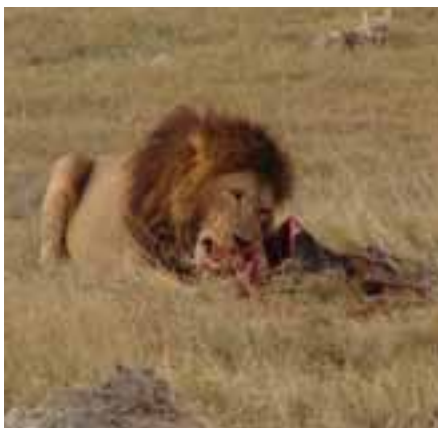
Ein Löwe beim Frühstück, das ihm seine Löwen-Frau gejagt und gerissen hat

Entdecken Sie die Schönheiten und die Wildnis der Serengeti mit ihren Büffeln, Elefanten, Giraffen, Löwen, Leoparden, Hyänen, Gnus und Geiern während der Migration zu neuen Wasserlöchern, bestaunen Sie riesige Elefanten-Herden in Tarangire-Nationalpark, erleben Sie den Ngorongoro-Krater mit seinen über 30.000 wilden Tieren, besuchen Sie den Lake Manyara, die wunderschönen Flamingos, die frechen Affenherden, sehen Sie Plätze und Orte, die Sie an alte Tarzan-Geschichten erinnern, kommen Sie mit zu den legendären Massai-Kriegern in ihren Dörfern, - und erfahren Sie schließlich mehr über die Schiffahrt auf dem Lake Victoria; von hier beginnt der Nil, der längste Fluss der Welt, als „Blauer Nil“ seine 6.671 km lange Reise in das Mittelmeer. Die Reise beginnt mit der inkludierten Bahnfahrt (2. Kl.) zum Flughafen Frankfurt/Main, führt über Adis Abbeba und Mombasa zum Kilimanjaro. Sie übernachten während der Safaris in komfortablen Lodges und werden voll gepflegt (während der Game Drives/ Foto-Pirschfahrten mit Lunchpaketen).