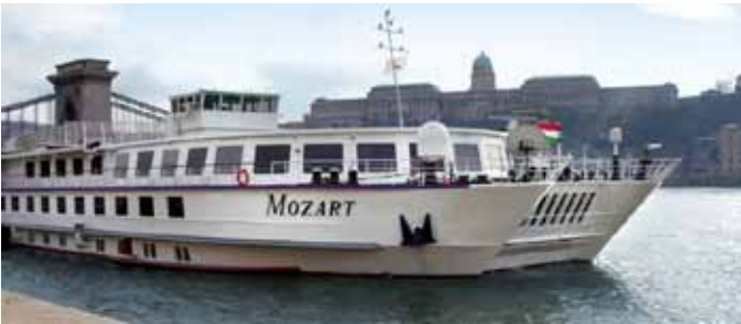
Am 1. April begann die „Mozart“, die in der Linzer Werft ÖSWAG grundlegend modernisiert wurde, ihre erste Reise. Seite 23