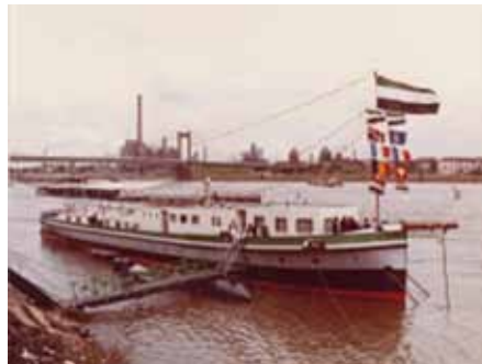
Schulschiff „J.W. Welker“

Ich gab mich zerknirscht und meinte niedergeschlagen: Das alles ist meine Schuld, ich war so stocksauer, weil sie mir die Prämie nicht ausgezahlt haben. Ich wollte doch heimfahren, (und dann fiel mir noch `was ein) weil doch meine Oma Geburtstag hatte. Der war zwar schon etwas länger her, aber so lange auch wieder nicht. Plötzlich meldeten sich die anderen, denen er das Taschengeld gekürzt oder gestrichen hatte, auch zu Wort. Sie hätten auch alle heimfahren gewollt. Tante, Onkel, Schwester, Bruder, Cousinen und Cousins, alle hätten Geburtstag gehabt.