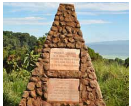
Grzimek-Denkmal. Ohne den berühmten Forscher gäbe es heute keine Serengeti

2. Tag: Arusha und Anfahrt zum Tarangire Nationalpark; 3. und 4. Tag: Lake Manyara und Fahrt zum Ngorongoro-Krater; 5. Tag: Ngorongoro-Krater; 6. Tag: Olduvai-Gorge (Wiege der Menschheit) und Fahrt in die Serengeti; 7. Tag: Serengeti; 8. Tag: Serengeti und Fahrt zum Lake Victoria; 9. Tag: Lake Victoria, Hafenbesichtigungen und Empfang bei der Lake Victoria Hafenverwaltung; 10. Tag: Fahrt durch die nördliche Serengeti zum Kilimanjaro Airport; 11. Tag: Flug nach Deutschland. ■