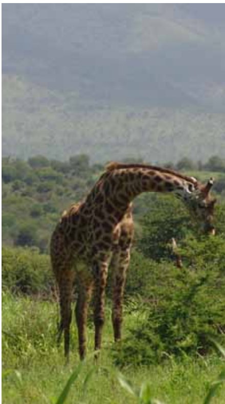
Tansanische Giraffen erreichen eine Körperhöhe von über 5 Metern